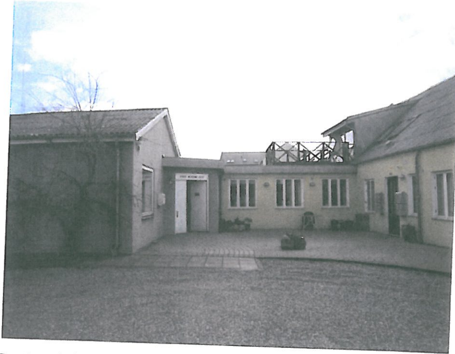
Bygning 2 (grå) og 1 (gul)