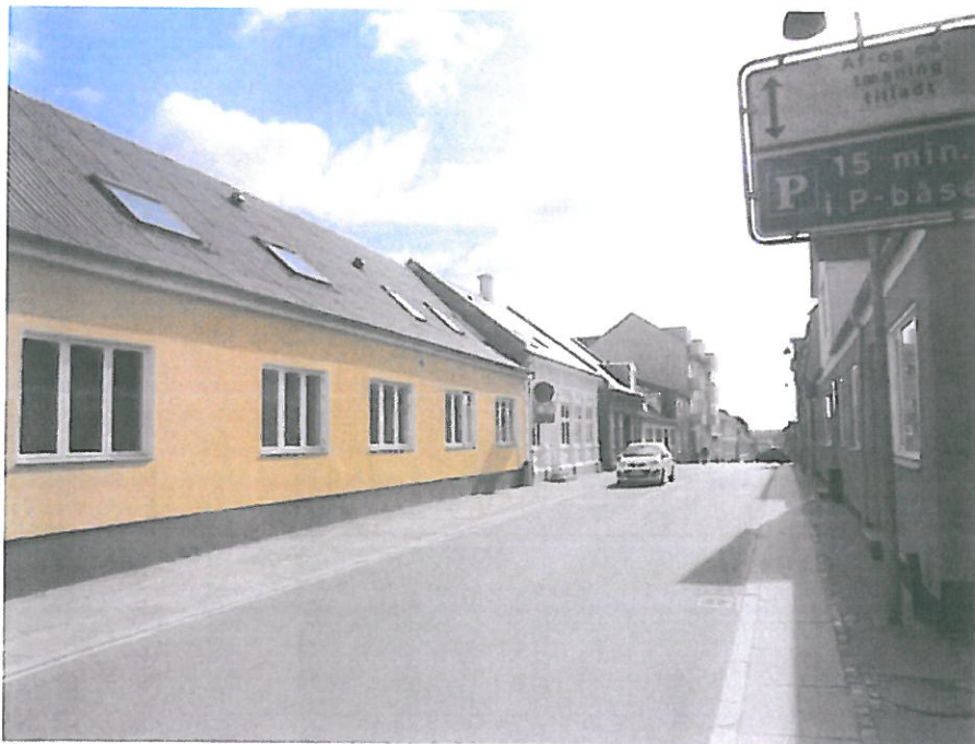
Bygning 1 (facade mod Storegade)