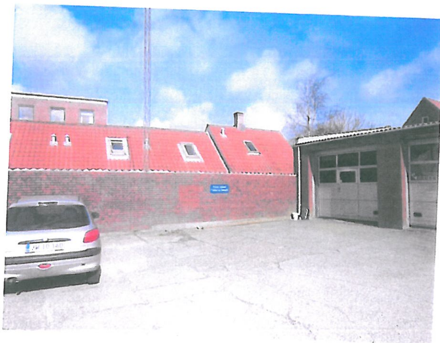
Bygning 3 (til højre med porte)